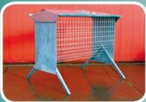
Voerhek met ruif en goot 30cm

Hoorruif met dak 1,2 ook leverbaar in 2,4mtr.