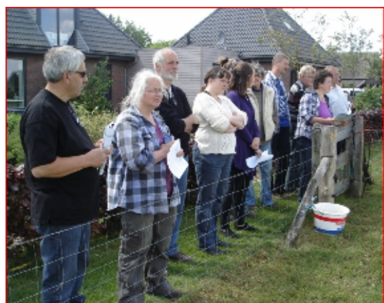
Op afstand worden de dieren met kundige fokkers ogen bekeken.