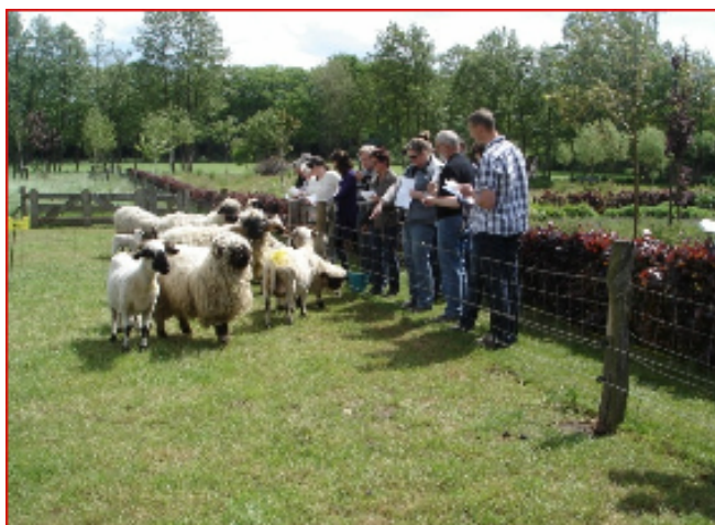
Er wordt door de deelnemers enthousiast beoordeeld en gekeurd.