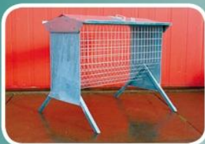
Voerhek met ruif en goot 30cm

Hooiruif met dak 1,2 ook leverbaar in 2,4mtr.